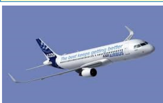
(Photos non contractuelles)

Les Sardes affirment que lorsque Dieu descendit pour la première fois sur terre, il mit le pied sur une île et créa instantanément la Sardaigne ! Il faut dire que ses plages frisent le divin. Les routes sardes mènent toutes à un village perché, à une superbe église romane, à une baie enfouie dans le maquis ou une crique secrète. Elles mènent surtout vers les habitants, bergers dans l'âme, fiers de leur gastronomie raffinée et de leurs vins savoureux. L'île majestueuse demeure l'une des dernières surprises de la Grande bleue.