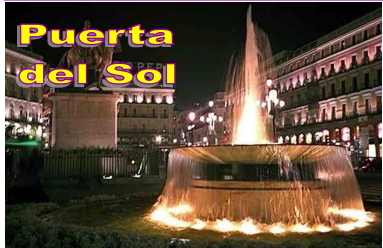
Puerta del Sol

J Notre localité - SARAGOSSE - MADRID 1 Départ dans la nuit de notre ville en Autocar Grand Tourisme en direction de l'Espagne. Déjeuner au restaurant à SARAGOSSE, visite libre du centre. Continuation, arrivée à Madrid en soirée. Installation à l'hôtel situé autour de MADRID, dîner et nuit