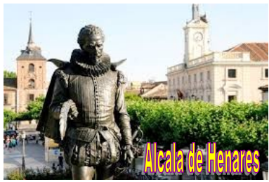
Alcala de Henares

J SEGOVIE 5 Petit déjeuner et départ pour la visite guidée de SEGOVIE classée UNESCO. La vieille ville gardé toute sa splendeur datant du Moyen Age et de la Renaissance : la maison de los Picos, la Cathédrale, le quartier des Chevaliers et l'Aqueduc romain, bijou d'ingénierie, que nous visiterons. 20 400 blocs de pierre se maintiennent dans un équilibre de forces parfait sans aucune pâte ou ciment ! Déjeuner au restaurant pour y déguster le plat typique de la ville : le cochon de lait rôti. Après midi, visite de l'Alcazar, forteresse militaire du XIIe siècle. Temps libre. Dîner et nuit à l'hôtel.